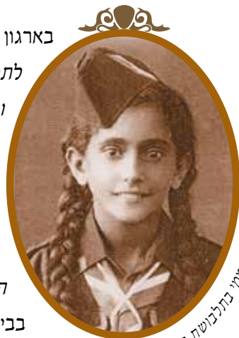
אהובתי חממי בתלבושת בית"ר

בארגון בית"ר הייתה חשיבות רבה לתלבושת "עלי לעיין שהגעתי לתנועה בתלבושת מלאה שכללה: חולצה חומה עם עניבה וכובע סירה חום. בגלל הצבע של התלבושת כינו אותנו "פאשיסטים". חברותה בתנועה סיכנה את לימודיה בבית הספר "תלמוד תורה לתימנים" "מנהל בית הספר הגיע לאמא ונתן התראה שאם אמשיך להגיע לסניף בית"ר הוא לא יקבל אותי ללימודים".