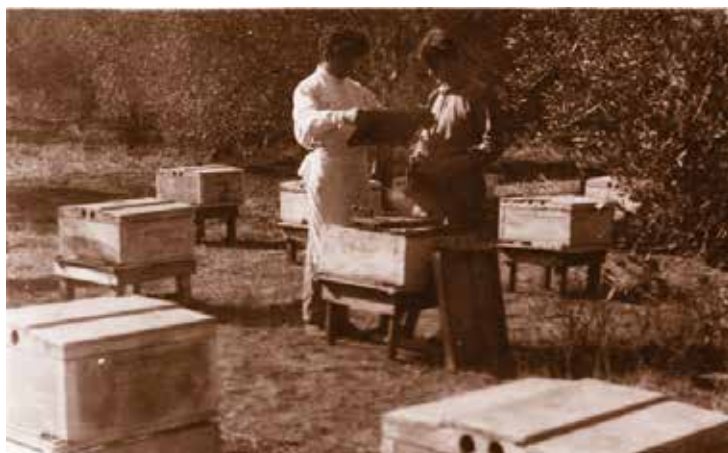
מכוורת גן שמואל ככרם יודים

ב-1921 התחלפה קבוצת החלוצים הראשונה באחרת והיא הייתה היסוד לקיבוץ גן שמואל.