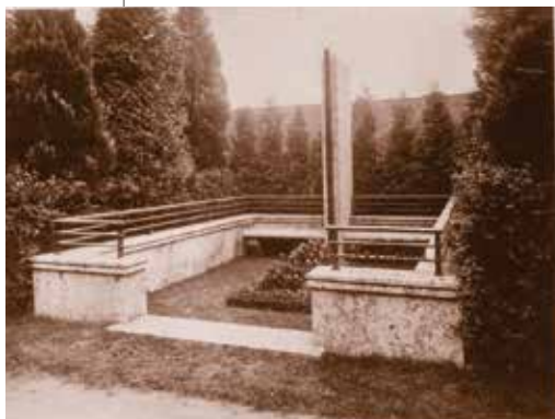
גדר בעיצוב מאייר למבד בבית העלמין בקלן 1931. (הוסרה ע"י הנאצים לשימוש במתכת)

בשנים 1909-1911 עבד מאייר במינכן. 8 מגוון הצעותיו לאלמנטים ארכיטקטוניים ולחפצים שימושיים הלך וגדל. בתיקו נראים סימבולים יהודיים דוגמת מנורה ומגן דוד. מאוחר יותר, ב-1926 בעיר קלן, שם הקים את סדנתו. 9 הוא עיצב לעצמו לוגו ובו אלמנט של סדן עליו ניצבים ראשי התיבות של שמו.