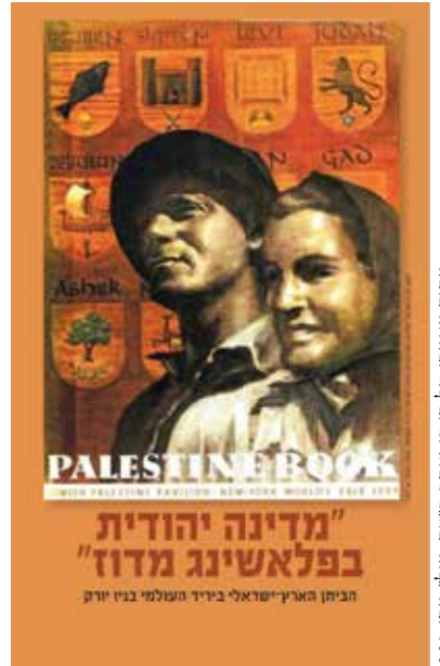
מתוך מאמרו של דן בן יעקב ב'עית-מוז' מס' 220

בכתבה בעיתון Brooklyn Eagle [NY Daily] מיום 1.1.1941, מדווח על בית הכנסת The Brooklyn Jewish Center, 667 Eastern Parkway N.Y. שרכש 'עיתורים' מאגף ארץ ישראל בתערוכה העולמית, שיפארו את ארון הקודש על הבימה בבית הכנסת. העיתורים הם: 2 דלתות לארון, הקודש ו-2 פמוטות מיציקת ברזל, בעיצוב האמן 'הפלסטינאי' יצחק מאייר. 17