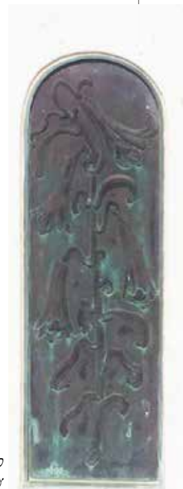
פרט מעיטור המצבה