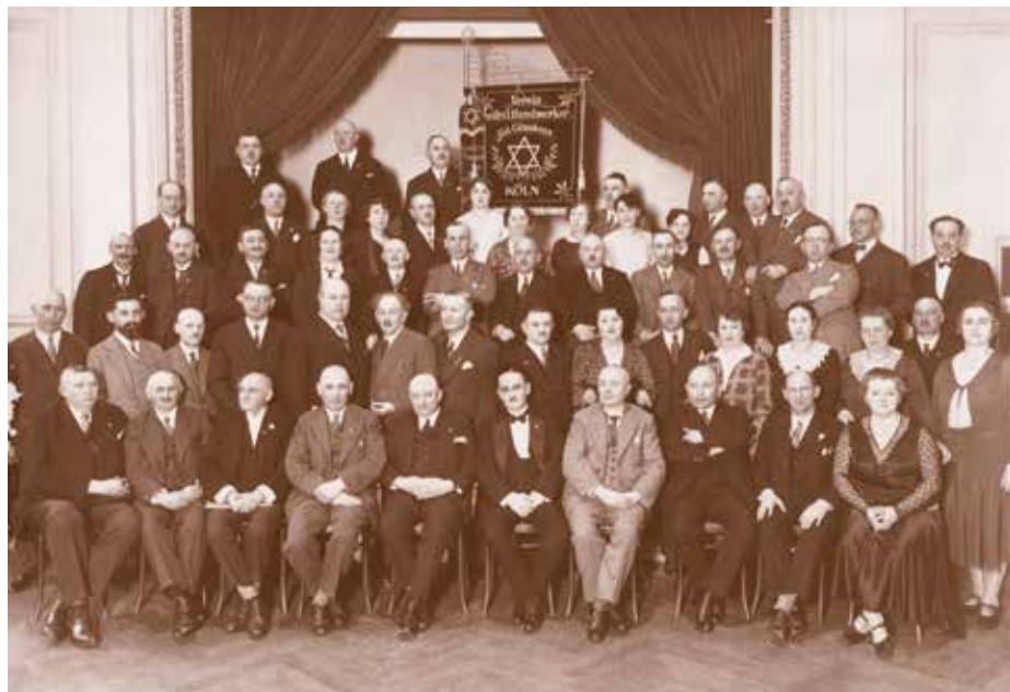
אגודת בעלי המלאכה היהודיים של קלן

באותן שנים היה מאייר חבר באגודה (גילדה) של האומנים היהודיים של קלן. מעמדה האיתן של הגילדה ניכר מנס הגילדה, המוצב בגאווה בראש התצלום הקבוצתי של חברה ובנות זוגם(?) ובו שלושה סמלי מגן דוד.