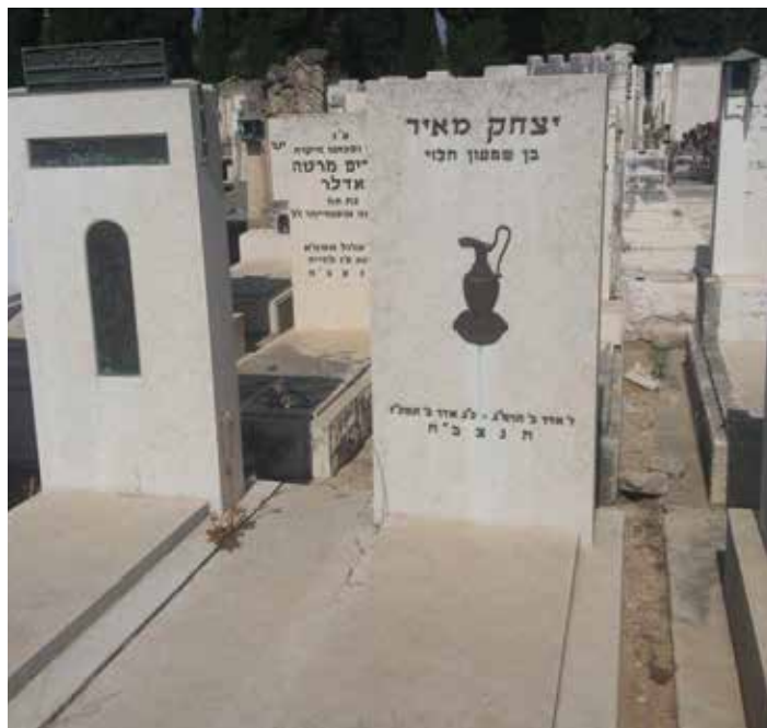
יצחק מאייר עיזב וביצע את קברה של דינה. למעלה כתב "ביתה היה עולמה"

יצחק בן שמעון מאייר נפטר בגיל 84 ביום כ"ג באדר ב' תשכ"ז, 4.4.1967, ונקבר בקרית שאול, 25 ליד רעייתו. 26,27