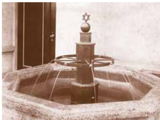
מזרקת מתכת מעוטרת של מאייר בכניסה לבית העלמין היהודי בקלן. (הוסרה ע"י הנאצים לשימוש במתכת)