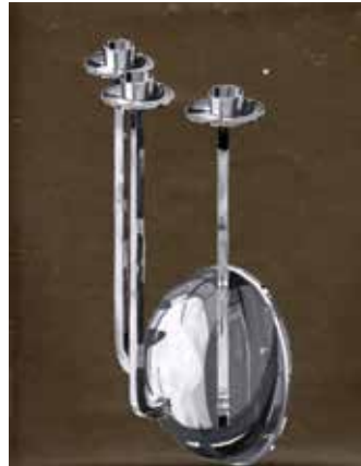
רישום של פמנט