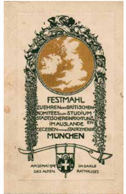
הזמנה לארוח משלחת מאנגליה 26.5.1907