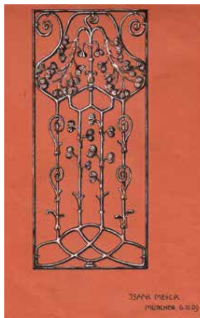
מתווה לסדרג מותכת, מינכן 1909

בשנים 1909-1911 עבד מאייר במינכן. 8 מגוון הצעותיו לאלמנטים ארכיטקטוניים ולחפצים שימושיים הלך וגדל. בתיקו נראים סימבולים יהודיים דוגמת מנורה ומגן דוד. מאוחר יותר, ב-1926 בעיר קלן, שם הקים את סדנתו. 9 הוא עיצב לעצמו לוגו ובו אלמנט של סדן עליו ניצבים ראשי התיבות של שמו.