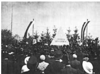
טכס חנוכת האנדרטה

בבית העלמין היהודי של קלן Bocklemuend, הוקמה ב-1934, אנדרטה לזכר החללים היהודיים בצבא גרמניה במלחמת העולם הראשונה. האנדרטה תוכננה על ידי האדריכל רוברט שטרן, קרוב משפחה של מאייר. את אותיות המתכת על גבי האנדרטה ביצע יצחק מאייר.