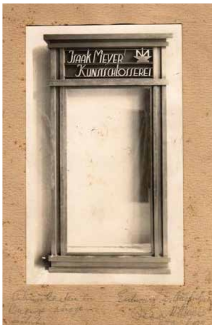
חלון הראווה של סדנת מאייר בקלן