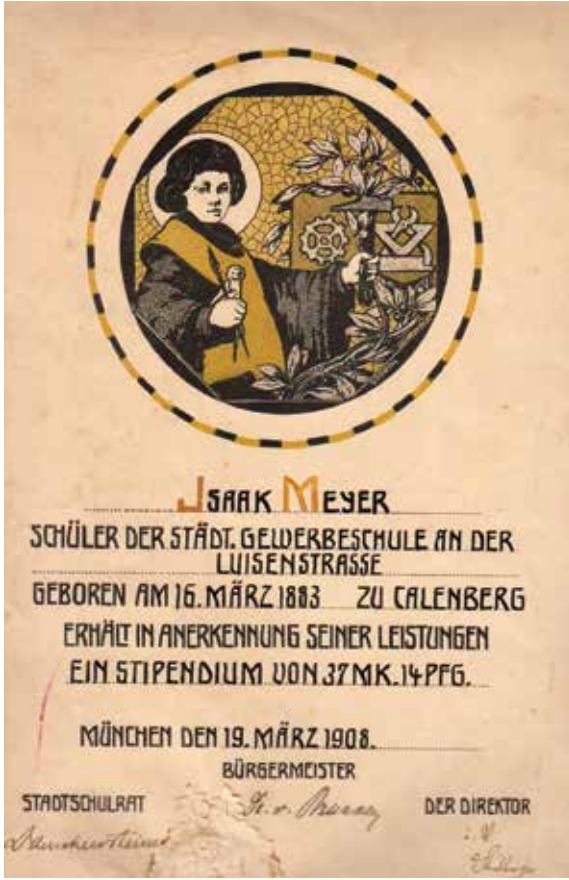
אישור קבלת מילת לימודים למכללה לאומיות של מינכן